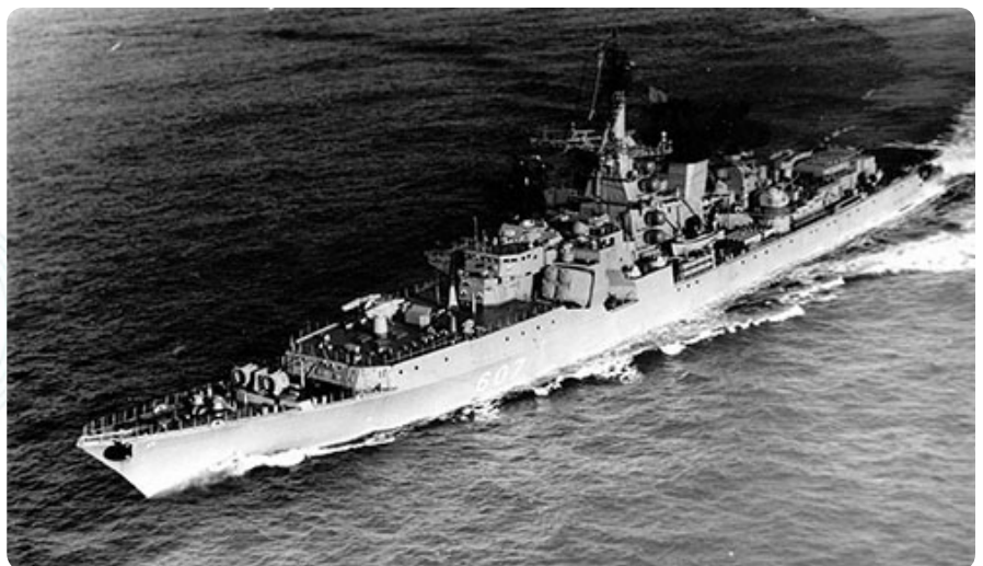
Большой противолодочный корабль «Адмирал Юмашев»

Но как бы хорошо ты ни знал корабль, есть много укромных уголков, в которых человека трудно найти, даже если задаться такой целью. По этому поводу вспоминается замечательный случай. Авианесущий крейсер «Бак» достраивался в Николаеве, и принимать его послали моряков Северного флота.