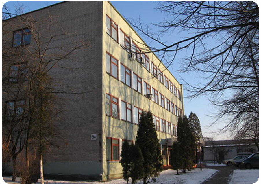
Здание Рембыттехники, в котором с 1998 по 2006 годы размещался третий филиал. Занимал часть первого этажа, половину второго и часть четвертого.