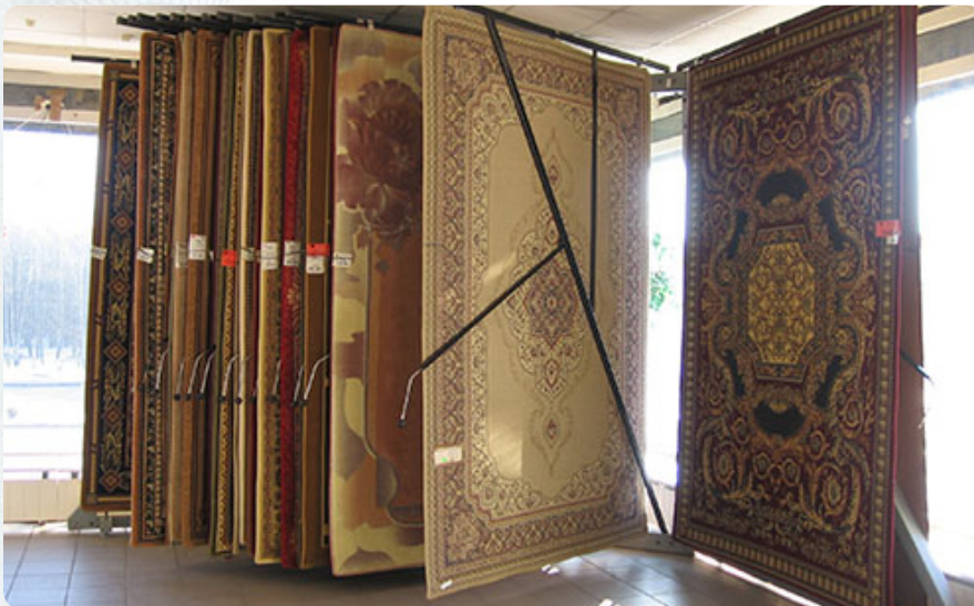
«Ковры Бреста» - первый клиент третьего филиала

В начале 2000-го открылся центр банковских услуг в Старых Задворцах. Раньше здесь был таможенный терминал, а сейчас – авторынок и Межрайонное регистрационно-экзаменационное отделение ГАИ. Не удивительно, что обычно здесь яблоку негде упасть: только по регистрации транспорта ЦБУ обслуживает по четыре сотни человек в день, и у каждого минимум по три платежа, а это тысяча двести операций.