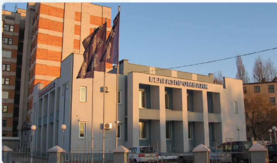
Новое здание филиала №3 ОАО «Белгазпромбанк»