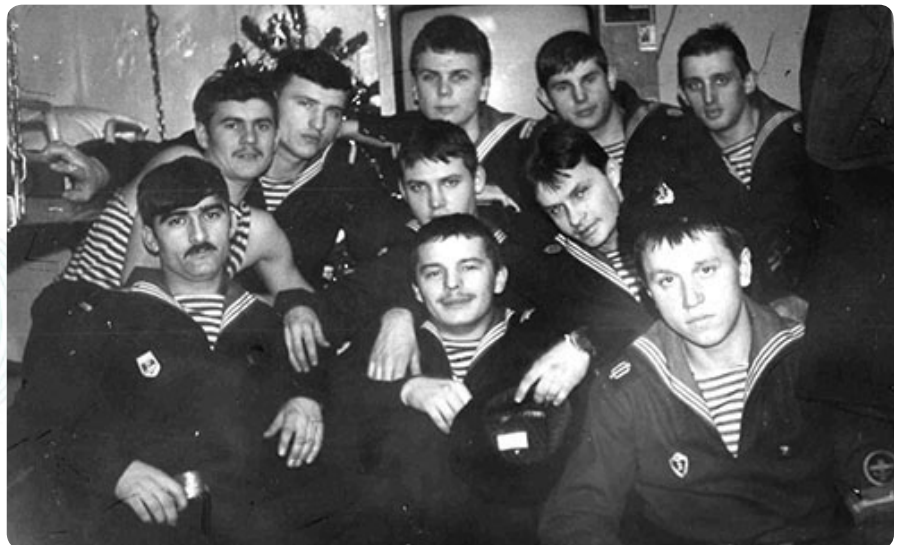
Новый Год по-флотски (1986)

Матросы питаются в камбузе, мичманы и сверхсрочники – в малой кают-компании. Офицеры же едят в большой кают-компании, где стоит рояль, столы