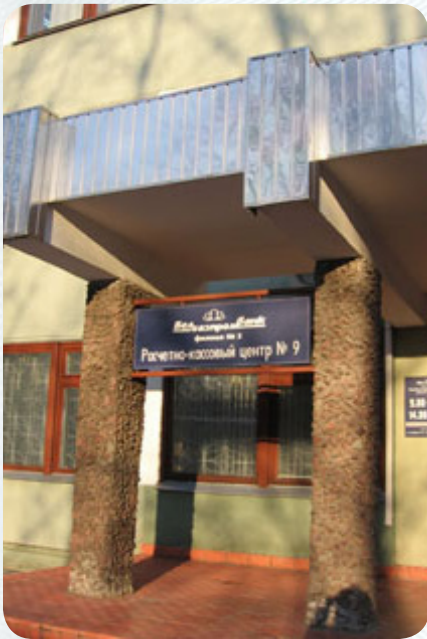
Сейчас в этом здании располагается расчетно-кассовый центр №9

Первого февраля 1999 года вышел первый баланс филиала (в формате .txt), эта дата и считается днем его рождения. А 15-го марта филиал уже выплачивал деньги на зарплату своему первому клиенту, «Коврам Бреста», в новом расчетно-кассовом центре.