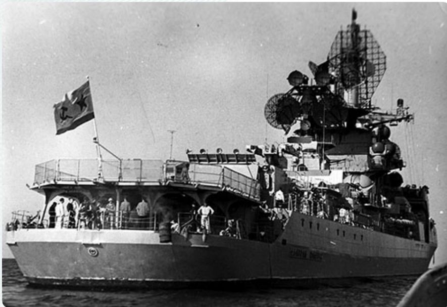
«Адмирал Юмашев». Вид с кормы.

для игр. У них есть такое правило: кресла командира и старпома в торцах стола священны, их не занимает никто, даже непосредственный начальник – командир бригады или эскадры. Если их приглашают на обед, они садятся по правую руку от командира.