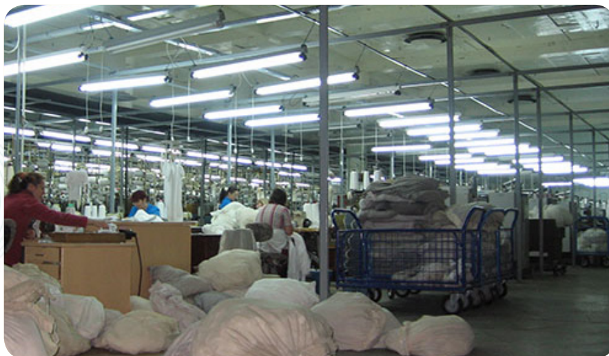
Это цех, где делают тонкие колготки

Кроме классических видов чулочно-носочной продукции, выпускаются женские полчулки, особо модные в последнее время молодежные гетры, носки для профессиональных занятий спортом – всего более 500 моделей. Каждый год обновляется половина ассортимента. В прошлом году комбинат выпустил почти двадцать семь миллионов пар – по пять носков на каждого белоруса.