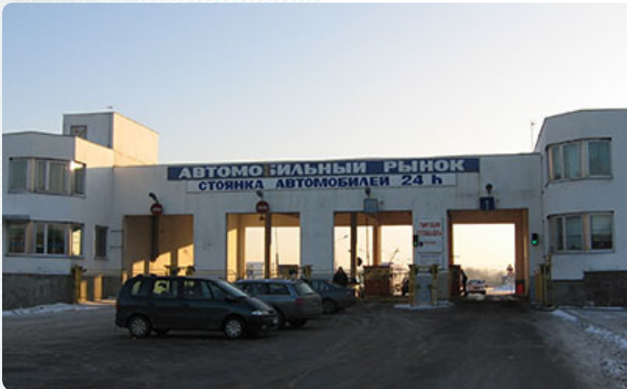
Авторынок в Старых Задворцах