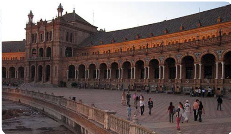
Севилья, Центральный дворец, построенный к Иберо-Американской выставке 1929-1930 годов.