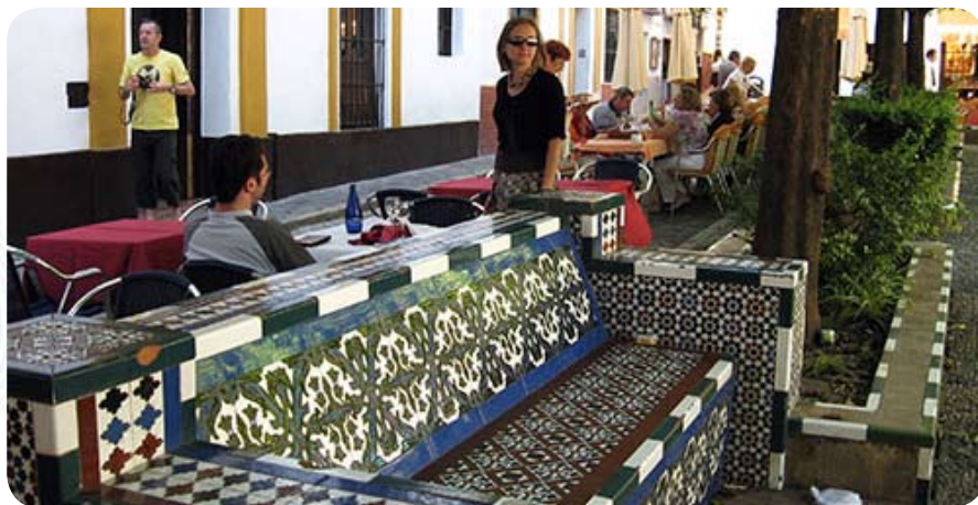
Скамья с изразцами в одном из скверов Севильи, где расположен дом Эсмеральды, героини «Севильского цирюльника».