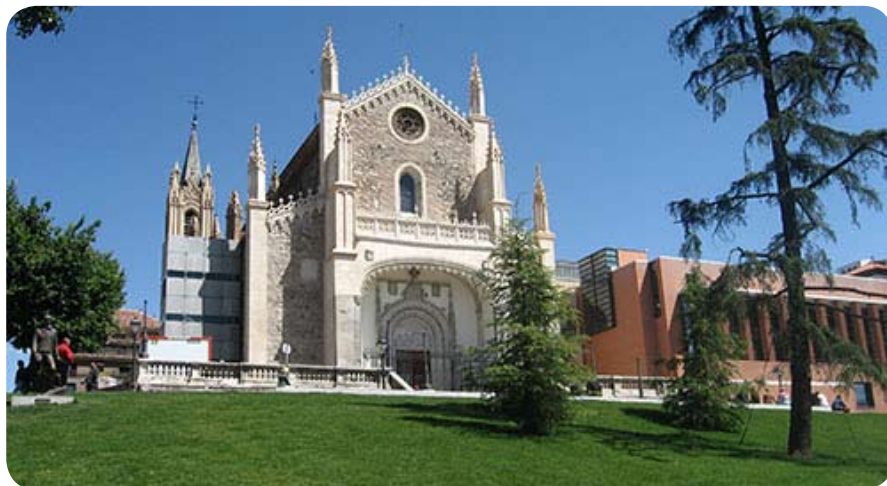
музей Прадо, церковь Сан-Антонио де ла Флорида, в которой до сих пор сохранились росписи Ф. Гойи.