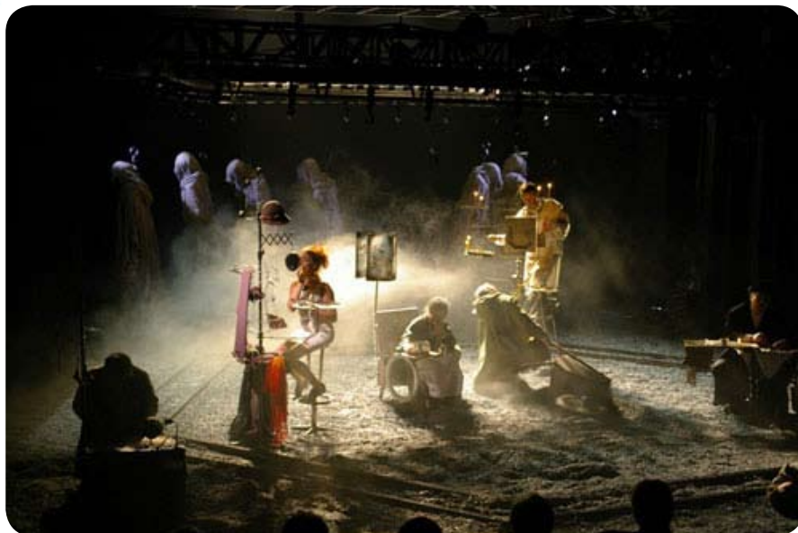
Российский спектакль по роману Людмилы Улицкой прошел при анилаге

Спектакль «Даниэль Штайн, переводчик» вызвал разноречивые зрительские эмоции, но главное, аудитория встретила его с огромным интересом: зал был полон. Билеты также распродали задолго до белорусской премьеры, и это неудивительно. Ведь спектакль — лауреат Премии Правительства Российской Федерации, дважды лауреат высшей театральной премии Санкт-Петербурга «Золотой софит», участник международных фестивалей. Только Театру на Васильевском Людмила Улицкая позволила сделать инсценировку своего знаменитого романа, награжденного национальной литературной премией «Большая книга».