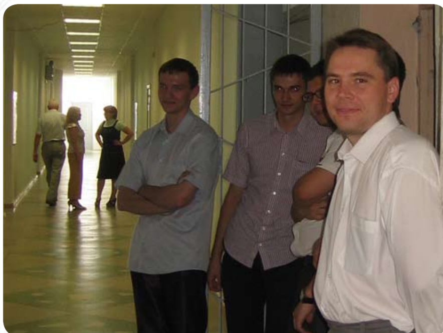
В это время возле учебного класса выстроилась целая очередь будущих доноров