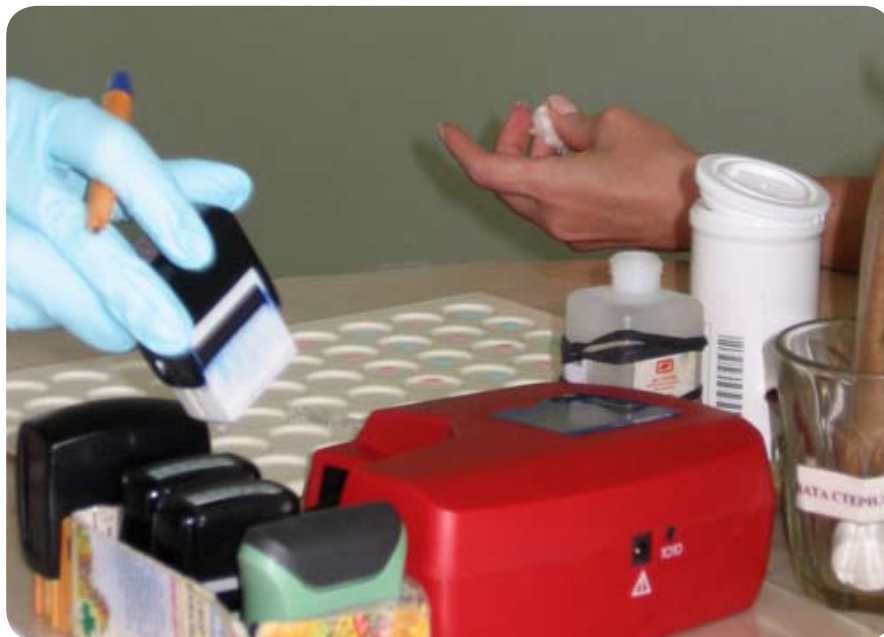
Лаборант на месте проверяет группу крови, резус-фактор и гемоглобин...