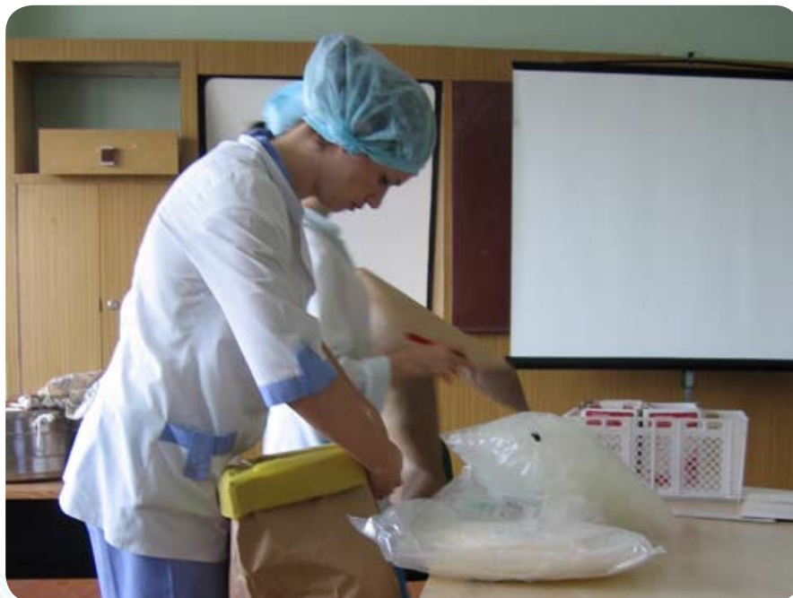
Перед началом акции специалисты центра переливания крови подготовили учебный класс Белгазпромбанка