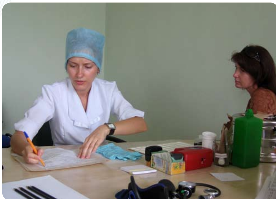
...и вписывает полученные данные в карту донора

– Кровь пойдет в различные клиники города Минска и Минского района нуждающимся в переливании. К примеру, много крови переливается после химиотерапии. Другая распространенная категория «потребителей» — послеоперационные больные, те, кто пострадал в различных авариях. Очень много донорской крови идет детям, имеющим заболевание лейкозами крови, а также людям, страдающим злокачественными опухолями.