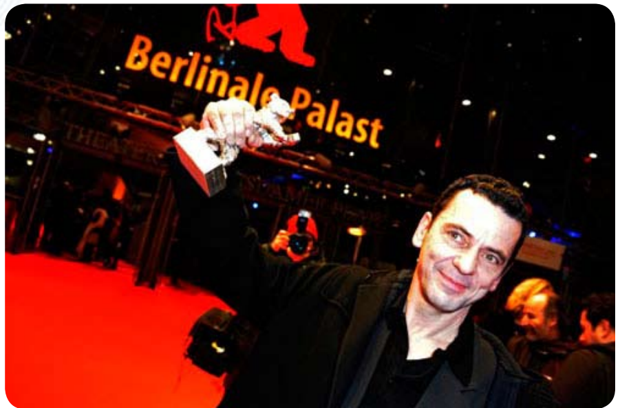
Лучшим режиссером на Берлинале-2012 стал немец Кристиан Петцольд за фильм «Барбара»

Было своего рода исключение для Берлинале – португальская лента « Табу ». Ее я не могу отнести к разряду любимых фильмов, но она удивила тем, что это именно чисто артистическое кино. Поставил эту картину бывший критик, и киномифология постоянно всплывает в этом черно-белом фильме, который обыгрывает и любительское кино, и немое, и авторское. Лично мне здесь не хватило не то что актуальной содержательности, но именно соотнесенности с реальной проблематикой, которая бы волновала всех и каждого. Это скорее красивая виньетка, о которой думаешь только в разрезе кинематографической эстетики, но не слишком глубоко погружаешься в эти сюжетные перипетии, поскольку они (опять же, на мой личный взгляд) не представляют большого интереса.