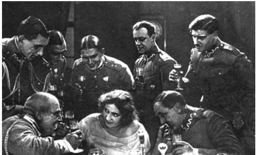
Кадр из фильма «Лесная быль» (1926 год), который официально считается первой белорусской кинокартиной

– Блеклая картинка, выцветшие краски... Здесь я больше склоняюсь к мысли, что копиям необходимо придать первоначальное авторское изображение. Естественно, в советские времена пленка не была столь высокого качества, как «Кодак». Чаще всего снимали на шосткинской пленке «Свема». Ее нельзя отнести к категории эталонных. Тем не менее, современные цифровые технологии позволяют реставрировать эти копии. Речь не идет о превращении в цветные поделки, как раскрашенные «Золушка» или «17 мгновений весны». Достаточно просто вернуть картине ее первоначальные цвета. Конечно, это требует определенных затрат. Но если это будет происходить, то мы будем вправе в рамках фестиваля проводить эти ретроспективы, привлекать дополнительную профессиональную аудиторию на наш праздник кино именно по причине уникальности, которую можно продемонстрировать.