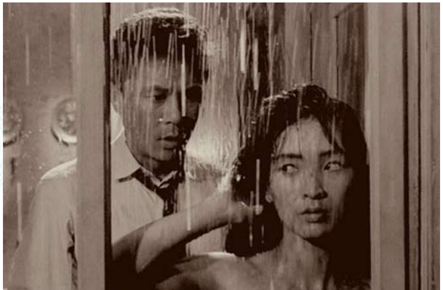
Кадр из оригинальной версии корейского фильма «Служанка» (1960 год), которая причисляется к классике мирового кинофонда

Опять же в Берлине проходили достаточно любопытные показы забытого и ныне никому не известного камбоджийского кино – «дополпотовского» ( т.е. до прихода к власти диктатора Пол Пота – прим.ред. ). Оно существует только в сверхредких копиях в американских архивах. Интересно, что картина 1968 года демонстрировалась не на языке оригинала, и этому есть простое объяснение. Когда Пол Пот пришел к власти, практически все культурное достояние, в том числе киношное, было уничтожено. Соответственно, что успело получить экспортную прописку, существует не на тайском языке. Открытие этих территорий дает дополнительный стимул для того, чтобы посещать подобного рода показы, даже если это не представляет большой интерес для искусства кино в глобальном смысле. И полный зал, и тот энтузиазм, с которым публика встречала эти фильмы и их авторов, говорит о том, что интерес к такому кино очень велик. Так что и старое искусство способно нас будоражить и вызывать в нас свежие чувства и эмоции.