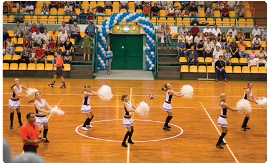
И тем, как девушки cheer leaders поднимали боевой дух команд