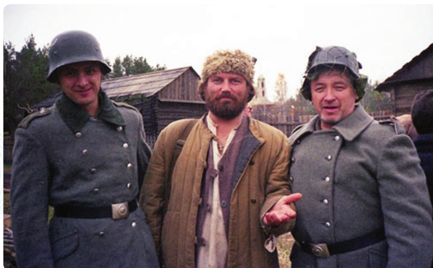
В свободное от съемок время оккупанты и партизаны делали совместные фото на память