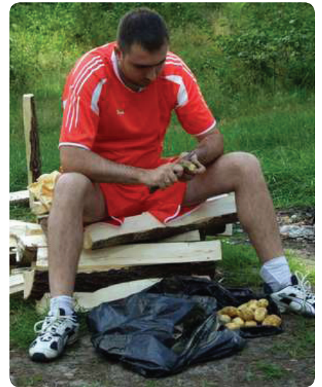
А это один из конкурсов. Команды получали набор продуктов, из которых за полчаса необходимо было приготовить что-нибудь съедобное.