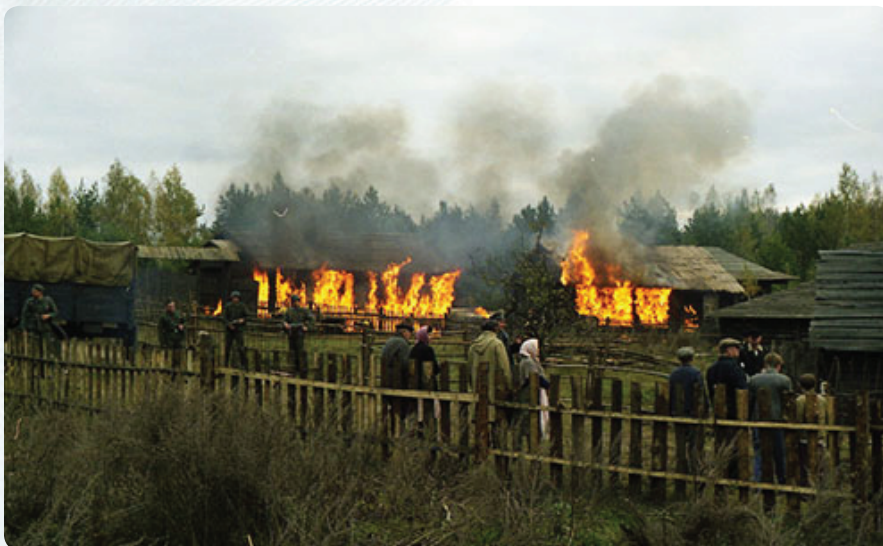
«Немцы» подожгли деревню

лось отснять материал, который ушел в монтаж. И к назначенному сроку фильм вышел. На премьере все аплодировали и говорили восторженные слова. Потом фильм еще какое-то время был в прокате в кинотеатрах. Сейчас его иногда показывают по телевидению, на 9 мая или День Независимости.