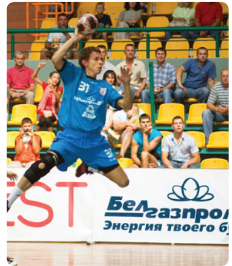
Где внимательно следили за ходом игр