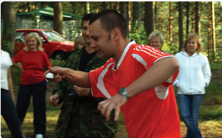
Триатлон «Супермен» был интересным: носили и теннисный шарик в ложке, и ведра с водой.