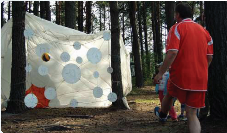
Третье место в соревнованиях по футбольному дартсу