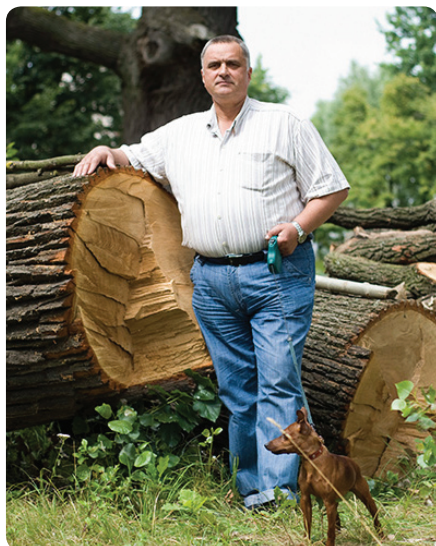
А это отломившиеся «веточки» векового дуба