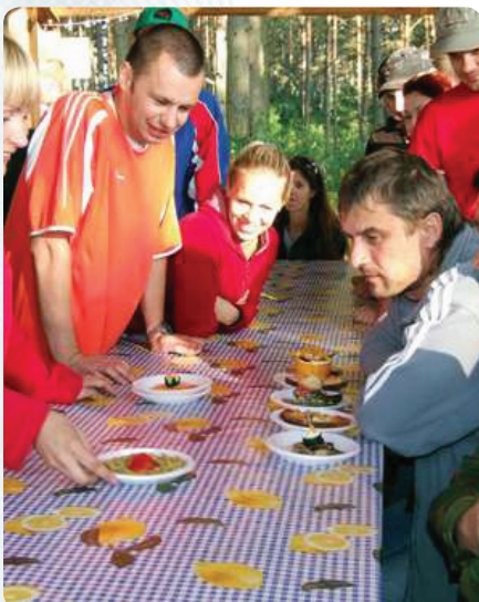
Наши презентуют антикризисный пищевой набор из семи блюд