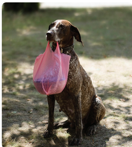
То, что уже не могли съесть, отдавали на хранение.