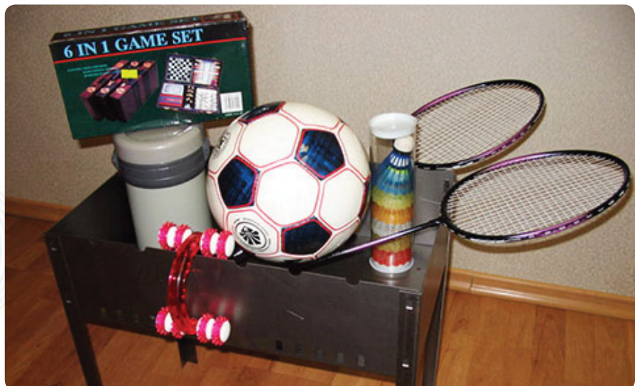
А это трофеи