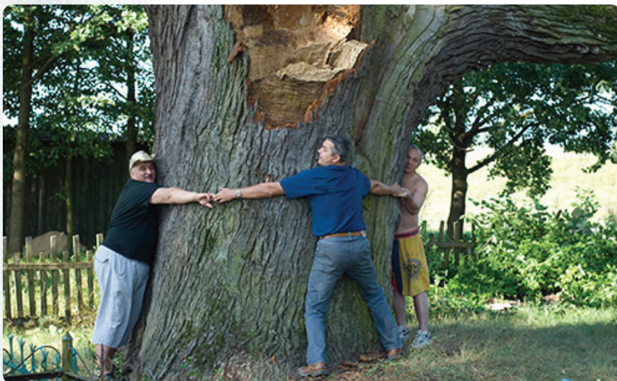
В охотничьем хозяйстве много достопримечательностей. Например, этот шестисотлетний дуб, который не смогли объять даже такие дюжие мужчины.