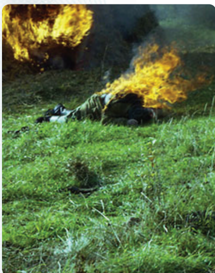
Даже профессиональные каскадеры иногда обжигаются