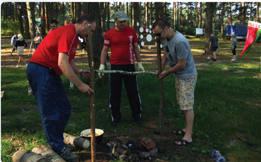
Так команда заботилась о пропитании: