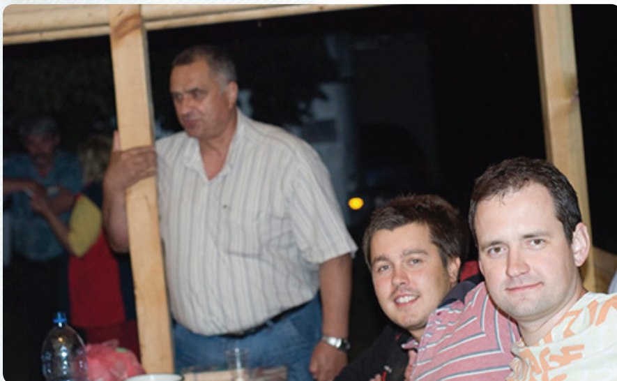
Впрочем, форма стен не важна, когда и те, и другие встречаются за общим столом