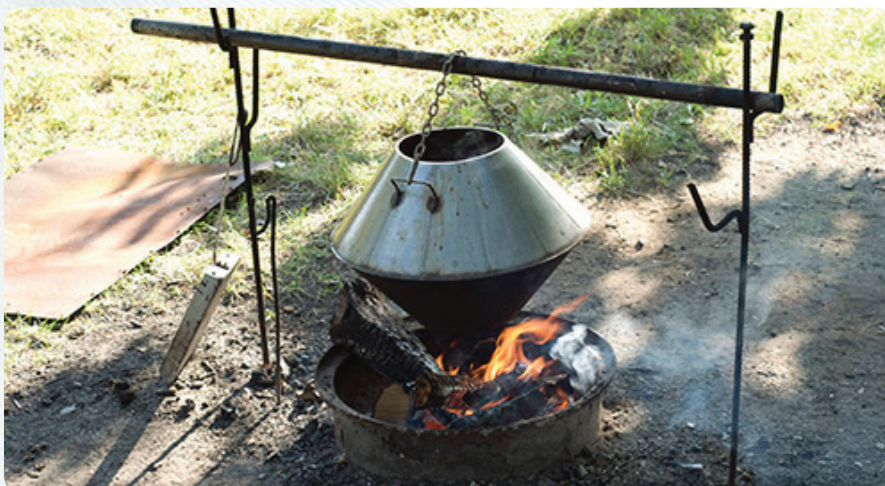
Тем более что на столе будет настоящая шурпа из похожего на юлу чана