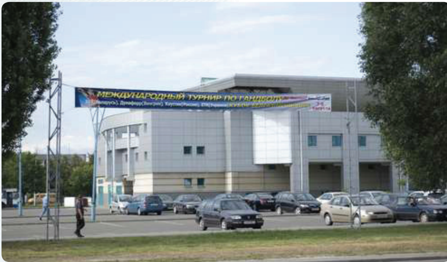
Минчане болели за своих не только дистанционно, но и, случалось, выезжали на место действия, в Брестский дворец спорта «Виктория»