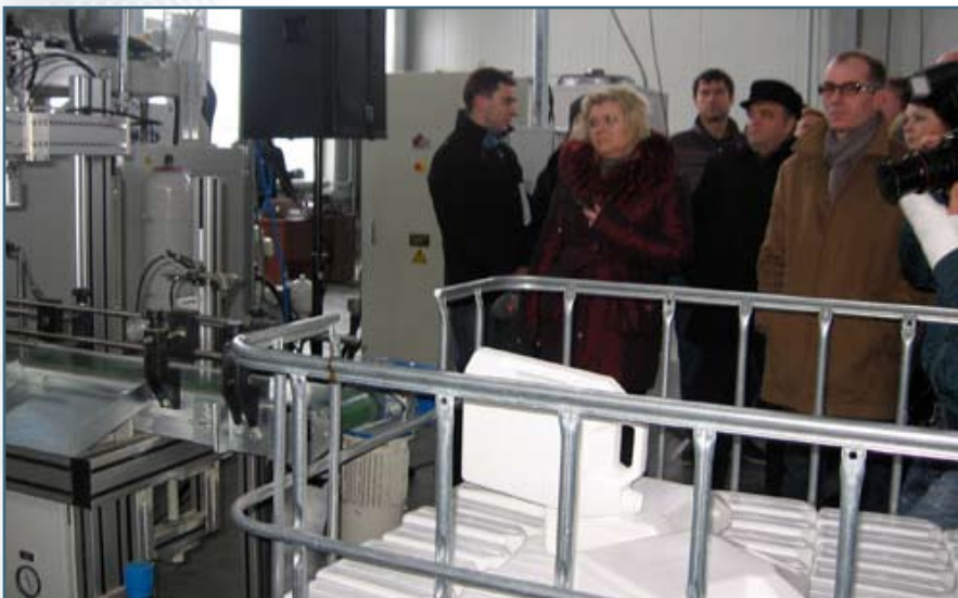
Участок по производству тары. На наших глазах за полминуты появилась новая канистра

И, естественно, нельзя не упомянуть и о том, что строилось данное предприятие в условиях жестких европейских стандартов экологической безопасности. «М-Стандарт» отвечает международным стандартам в области безопасности производства и успешно прошло процедуру проверки на соответствие экологическим нормам, установленным законодательством Беларуси.