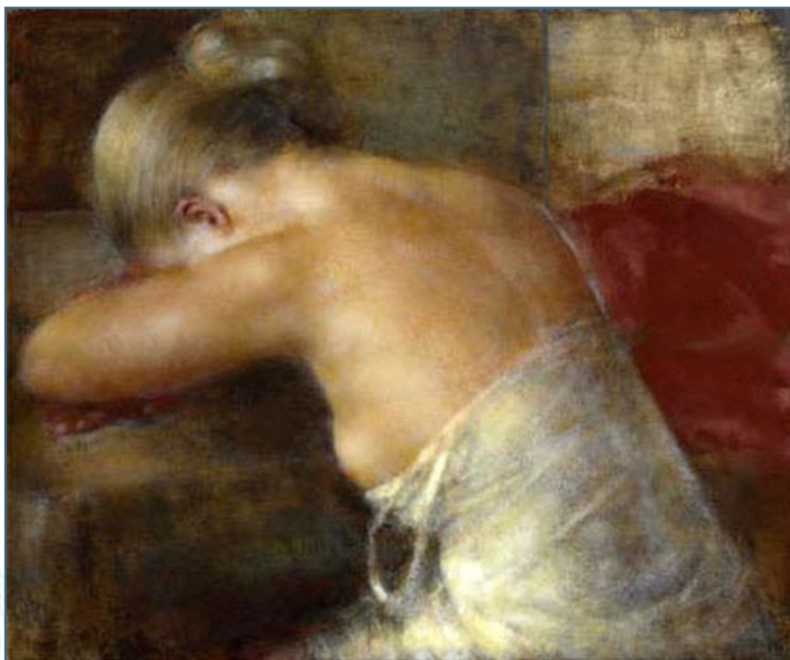
Девушка, склонившая голову