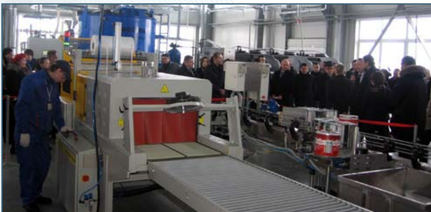
Среди гостей были представители СМИ и коммерческих организаций