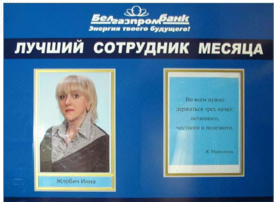
Рядом с главным входом в здание дирекции висит фотография лучшего сотрудника месяца, а также его жизненный девиз

общей целью. Каждый сотрудник должен понимать, что он влияет на жизнь банка, на результат его деятельности. Работа в банке – это работа в команде, и здесь нет личных успехов, есть успех общего дела. Мы не должны стоять на месте, мы развиваемся, движемся вперед. Именно этого я и хочу достичь.