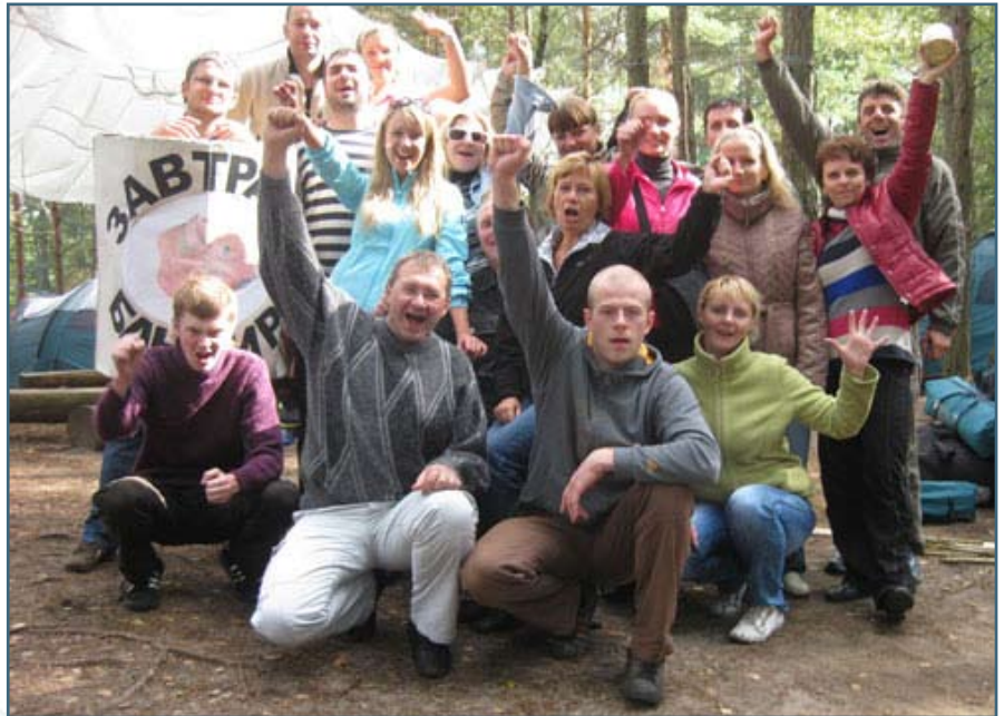
Покорится ли «Северной губернии» 10-й корпоративный турслет?

И еще одна задача, которую я ставлю перед собой – это работа над укреплением кадрового состава нашей дирекции. Мы сможем достичь результатов, которые перед нами ставит правление банка, только с помощью нашей команды, команды целеустремленных, инициативных сотрудников, объединенных