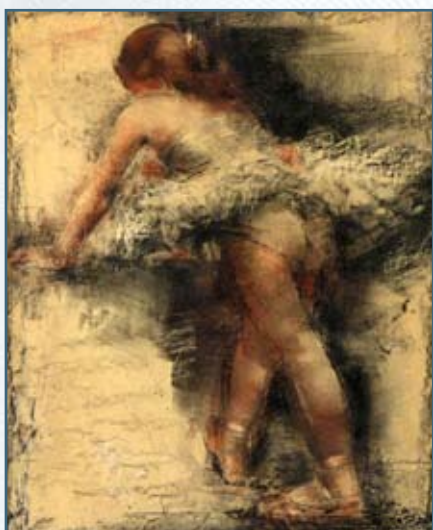
Балерина на репетиции