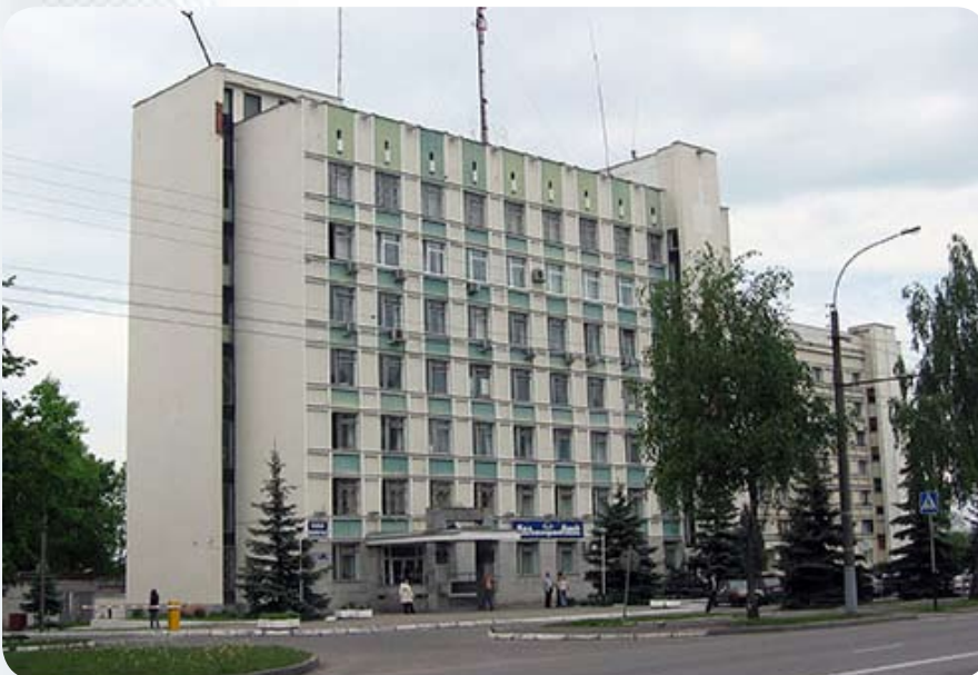
Малайчука, 12 – здесь расположен знаменитый коридор