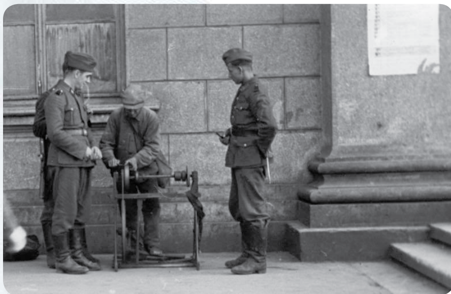
Уличный точильщик точит немецкие штык-ножи.