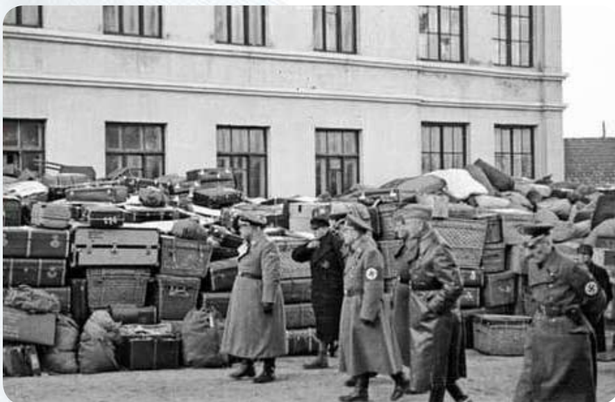
Вещи, конфискованные у евреев. Все это потом сложили в Оперном театре, который немцы превратили в склад-распределитель. Туда любили ездить закупаться жены немецких офицеров.