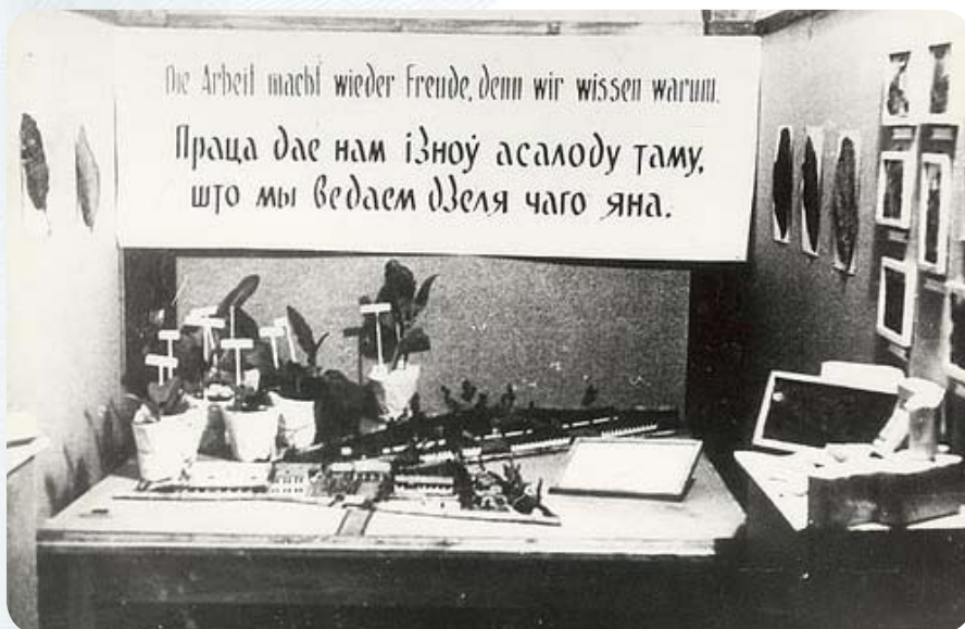
Экспозиция Музея белорусской культуры. 1943 год.