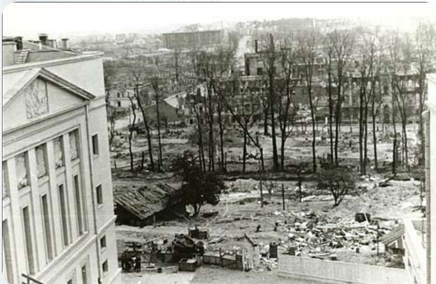
1942 год. Вид на центральный сквер с крыши Дома офицеров. Сквер уже почти полностью вырублен.