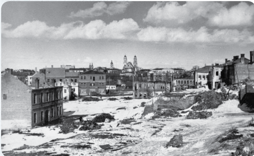
Вид на город где-то от нынешнего памятника Мицкевичу.