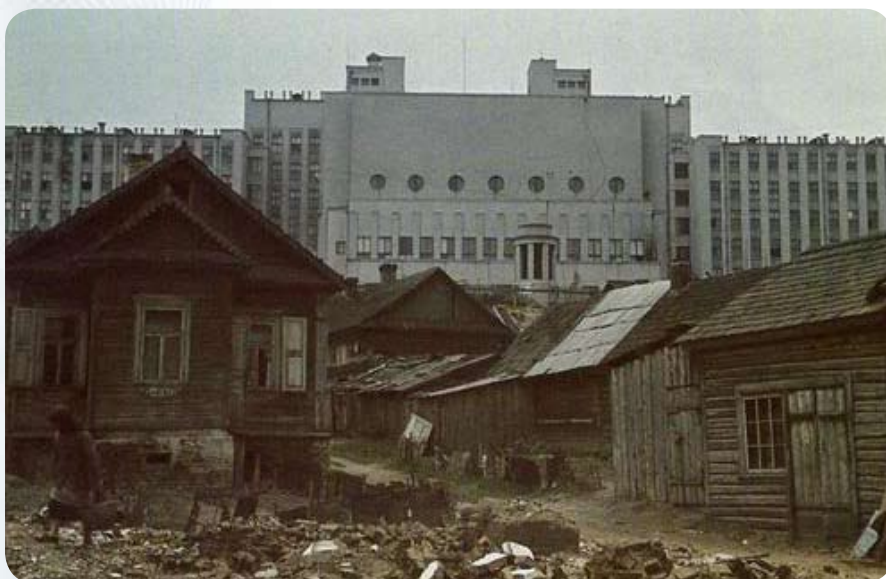
Вид на Дом Правительства со стороны улицы Мясникова. Это фото – отличный пример любимого приема немецких пропагандистов – «хижины и дворцы».