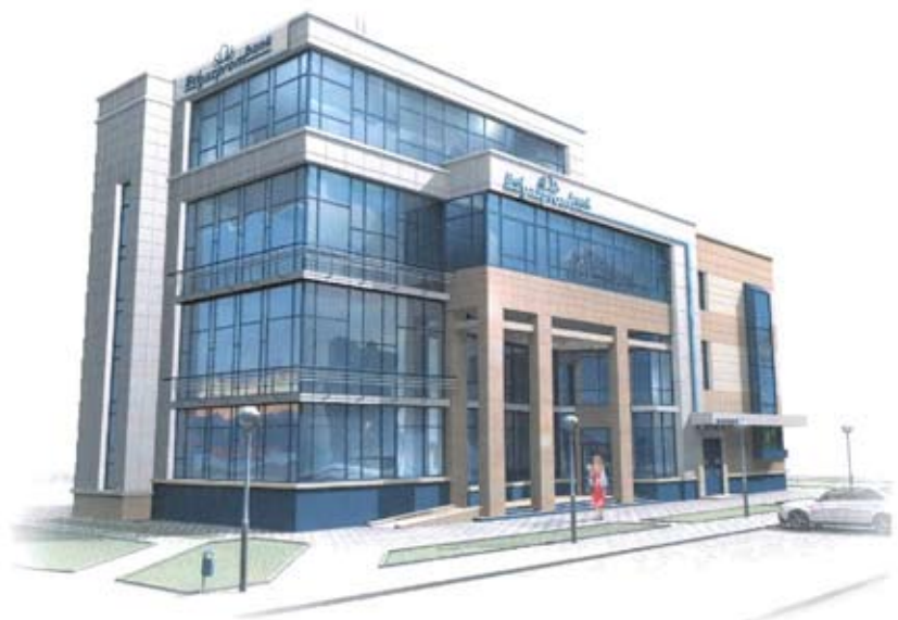
Один из вариантов здания мечты

У нас нет больших остатков на счетах, поэтому недостаточно пассивов. Необходим интенсивный рост, чтобы компенсировать наш поздний приход высокими темпами развития.