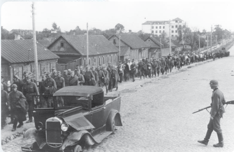
Колонна советских военнопленных предположительно в районе Комаровской развилки. Тогда четырехэтажное здание – корпус БНТУ на проспекте Независимости, 59.