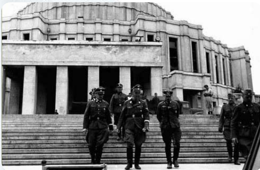
Фото на память на фоне Оперного театра.

В Минске Гимmlера ожидала насыщенная культурная программа. Посещение советской Государственной картинной галереи доставило «гостям» массу радости.