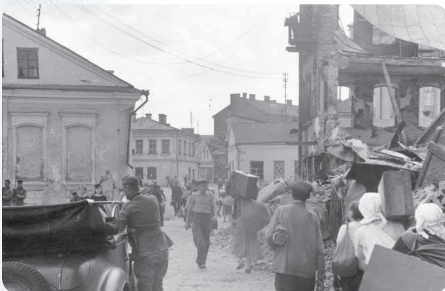
Беженцы в районе Немиги. На втором плане – дом на перекрестке Немиги и Раковской улицы, а сквозь окна дома на первом плане видна Петропавловская церковь.