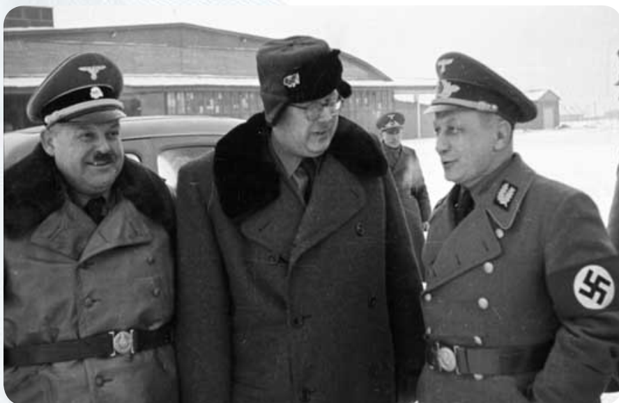
Слева: бригаденфюрер СС Карл Ценнер. Гауляйтер Хайнрих Лозе (в центре) с генеральным комиссаром Вильгельмом Кубе (справа).