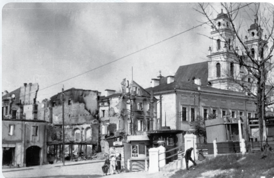
Руины домов на площади Свободы, Маринский костел и бывший дом губернатора.