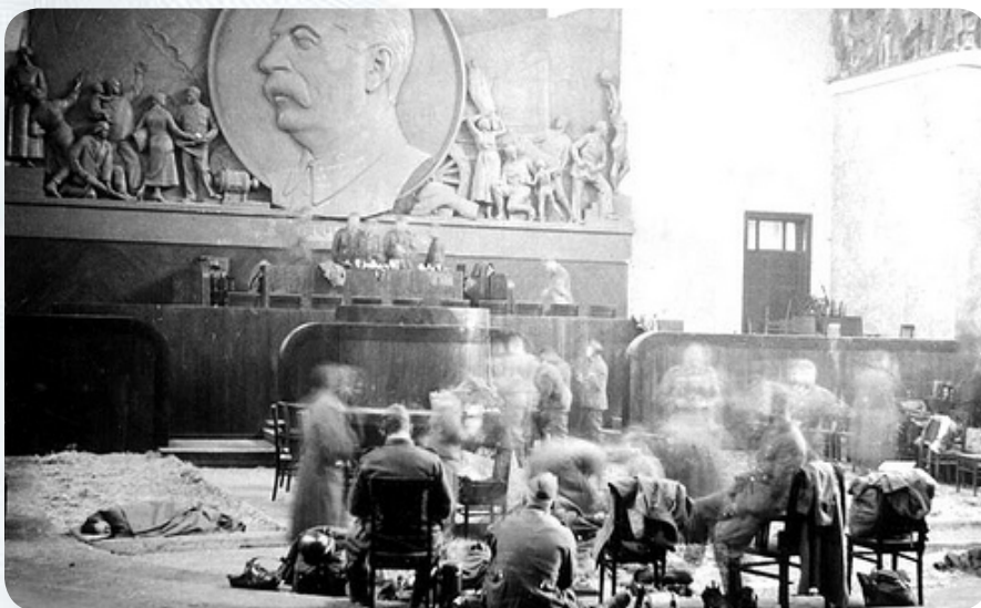
Дом правительства. Овальный зал. 1941 год. Кто-то фотографируется в президиуме, кто-то отдыхает посреди зала, а кто-то просто спит прямо на полу.

В подборке использованы материалы из блога жж-юзера basian, а также информация с сайта nazireich.narod.ru и copypast.ru