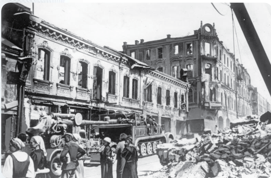
Немецкая техника проезжает перекресток улиц Советской и Энгельса.