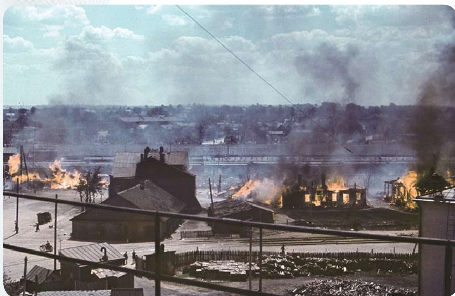
Панорама Минска. 28 июня 1941 года. Первый из 1100 дней оккупации нашего города. Пылают дома по улице Бобруйской.