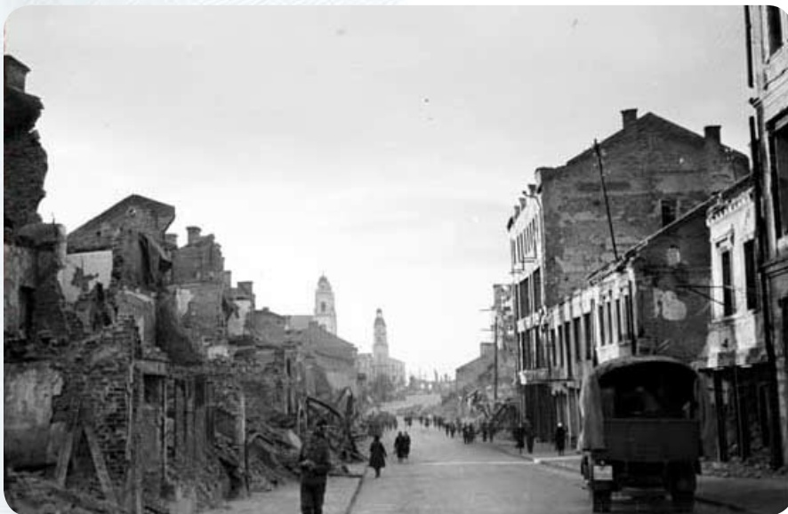
Улица Ленина. 1942 год.