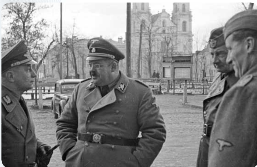
Слева: Вильгельм Кубе; в центре: бригаденфюрер СС Карл Ценнер. На заднем плане: площадь Свободы, кафедральный собор Девы Марии.