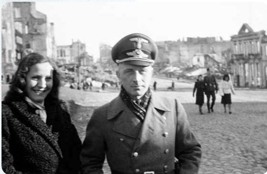
Площадь Свободы в Минске и разрушенный отель «Европа».