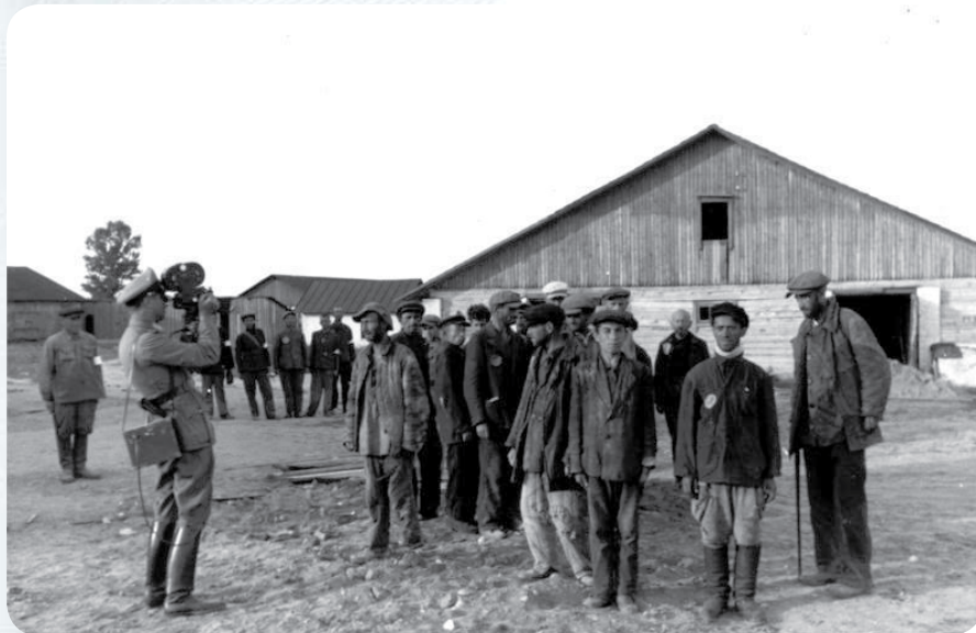
Немецкий пропагандист снимает узников минского гетто.