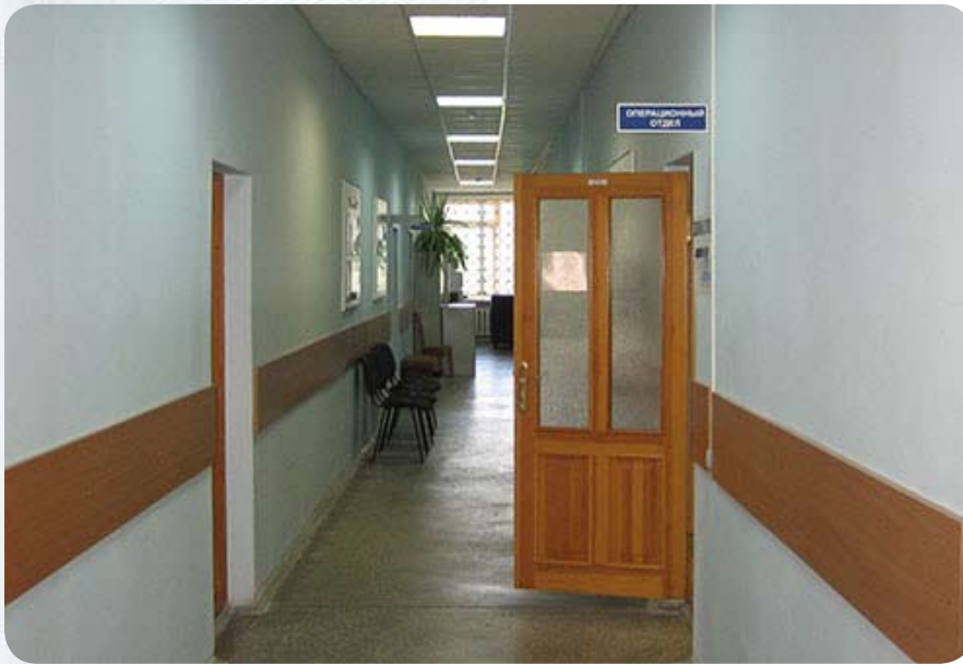
В филиале коридорного типа – обед

Поначалу играли, что называется, без правил. На поделенном рынке невозможно выжить без смелых ходов. Бизнес есть бизнес, и все хотят занять место под солнцем. Причем самое главное – не найти это место, а отстоять. Выходить на рынок в белых перчатках и робко просить клиента перейти к нам было бы, по меньшей мере, странно. Пришлось опираться на личные контакты, а не просто объяснять, что мы хорошие.