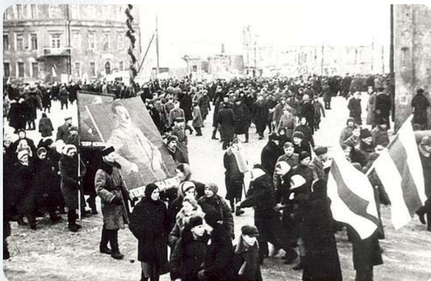
Митинг на площади Свободы в Минске в 1943 году.