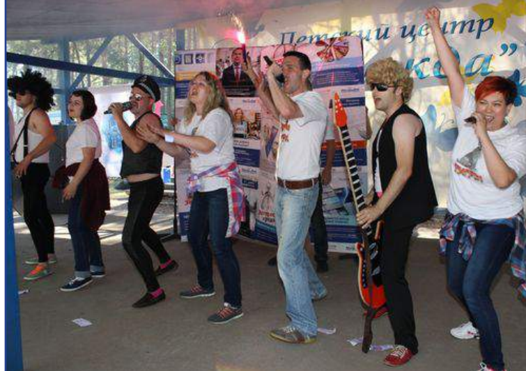
Выступление Гродненской облдирекции