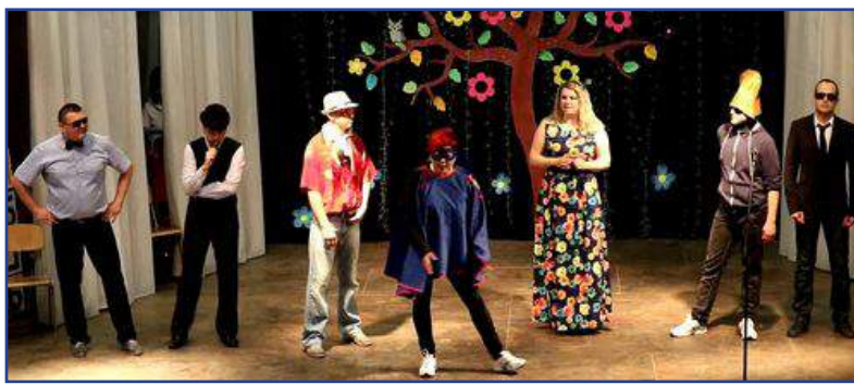
Выступление Гродненской облдирекции