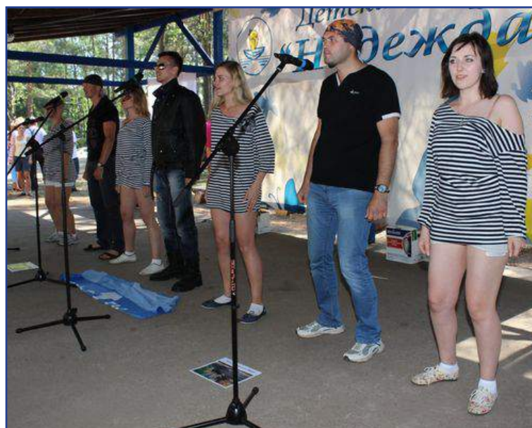
Выступление Гомельской облдирекции