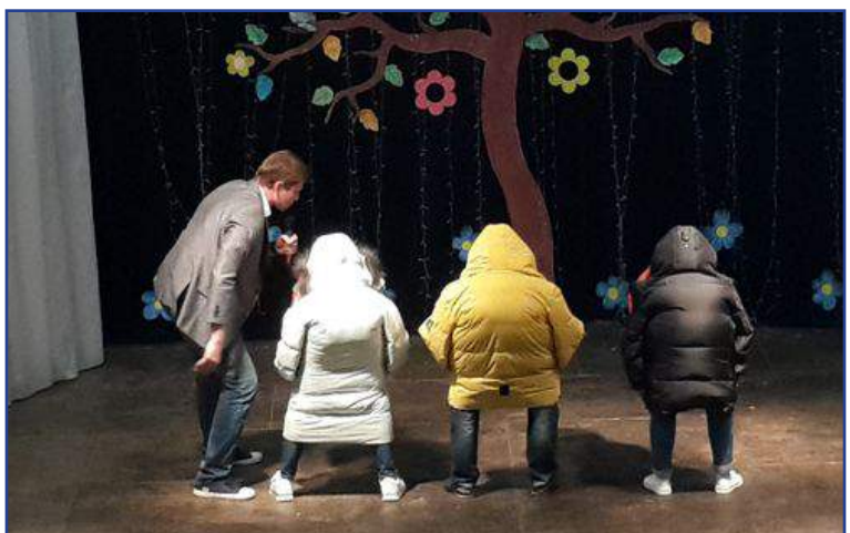
Выступление Брестской облдирекции