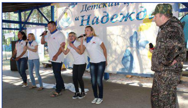
Выступление Минской облдирекции