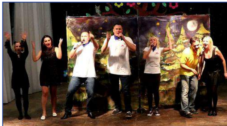
Выступление Минской облдирекции