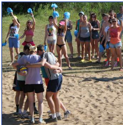
Турслёт-2016: фотомгновения . . . 8