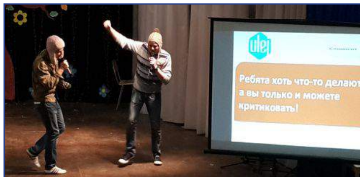
Выступление Брестской облдирекции

В материале использованы скриншоты из видеозаписи Михаила Жлобича