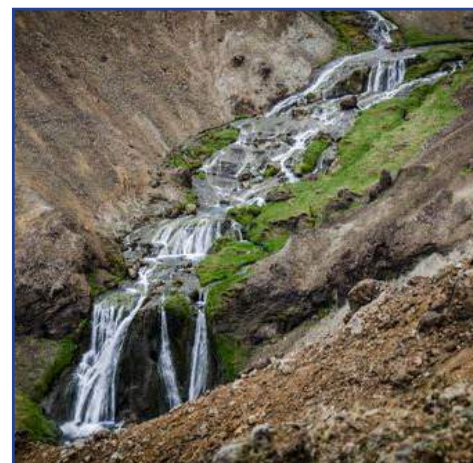
Родина футболистов-викингов . . 22

Тел/факс (017) 229-16-54, e-mail: kanash@bgpb.by