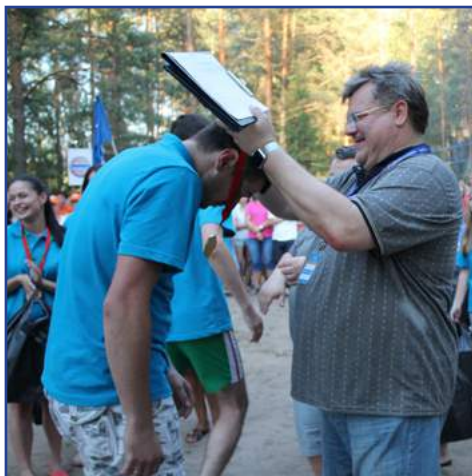
«Не боимся мы чёртовых дюжин – вместе все кризисы сдюжим!» . . . 3