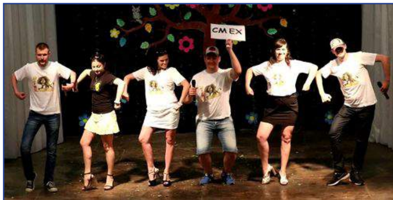
Выступление Могилёвской облдирекции