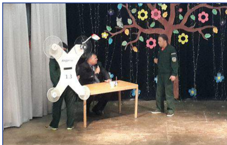
Выступление Брестской облдирекции