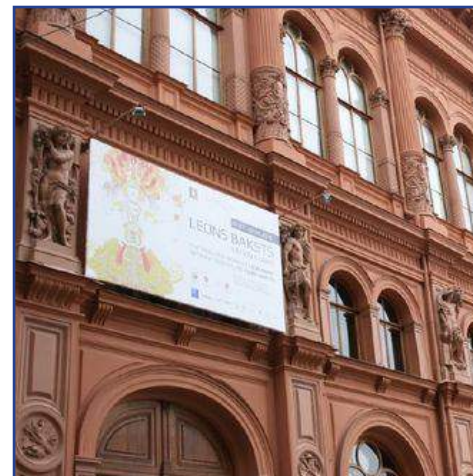
Выставка «Время и творчество Льва Бакста» открылась в Риге . . 12