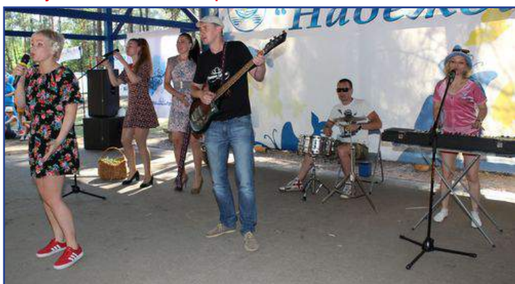
Выступление Витебской облдирекции