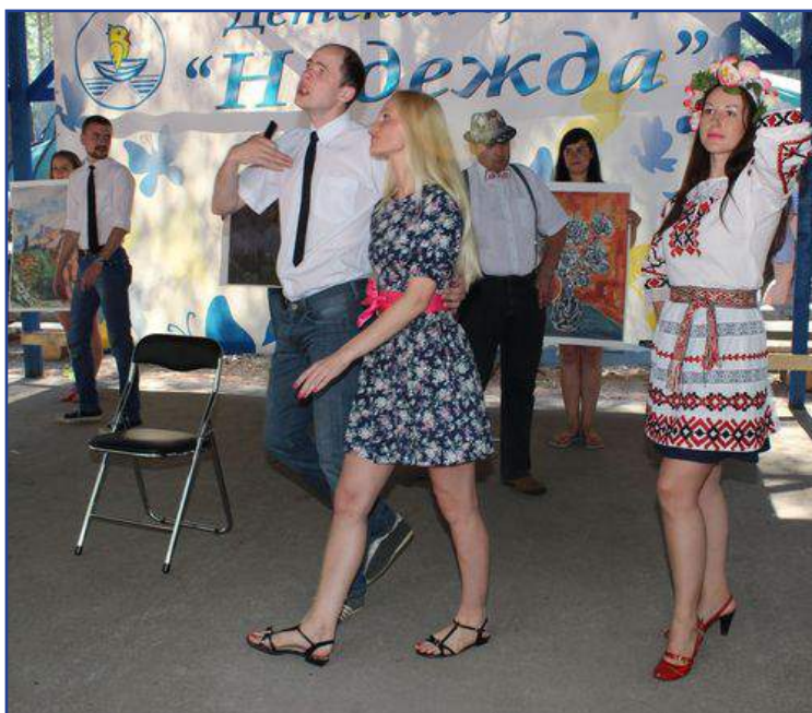
Выступление Могилёвской облдирекции