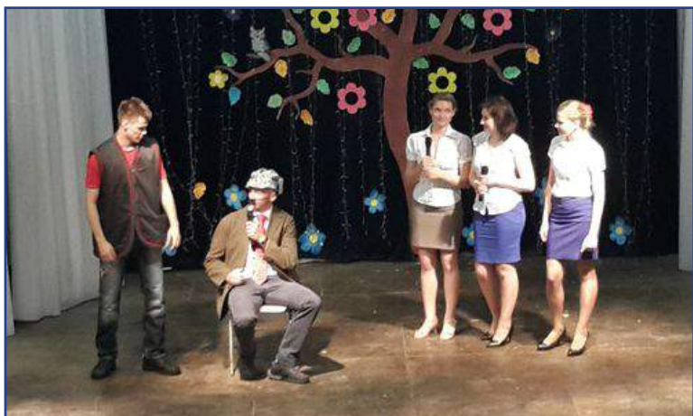
Выступление Гомельской облдирекции