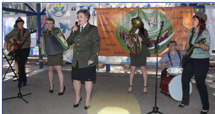
Выступление Брестской облдирекции