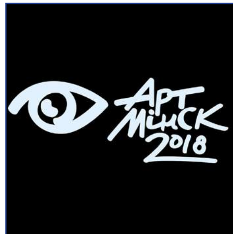
Приглашаем на «Art-Minsk»!..... 9