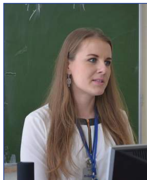
Как повышали финансовую грамотность в Могилёве..... 15

Тел/факс (017) 229-16-54, e-mail: kanash@bgpb.by