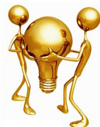
Лауреат маркетинговой премии «Энергия успеха» в номинации «Лучшее корпоративное издание»

Корпоративный журнал ОАО «Белгазпромбанк» Банк.NOTE №4 (109), апрель 2018 г.