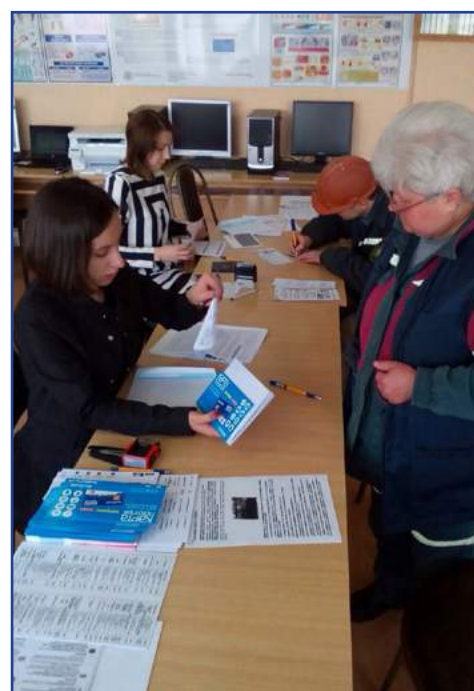
«Карта страхователя» – ваши неограниченные возможности! . . . 10