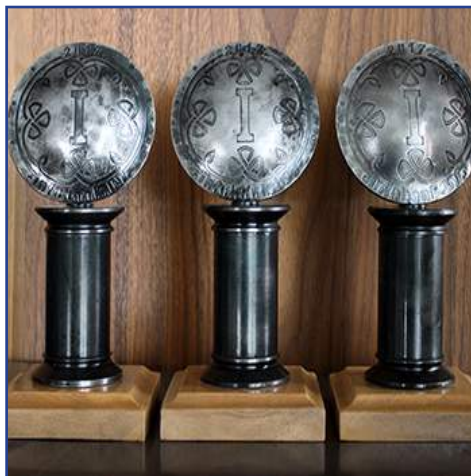
Белгазпромбанк получил пять наград на «Финансовой Масленице»..... 8