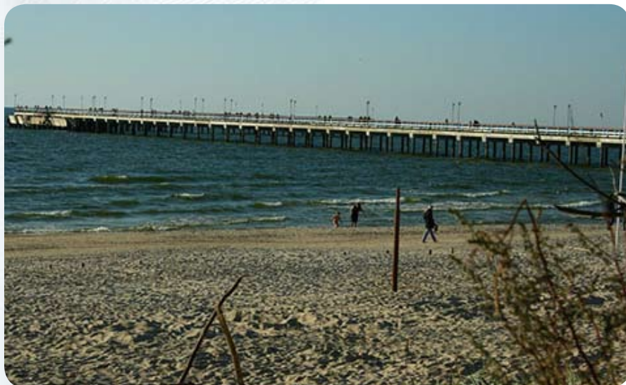
Пляж в Паланге

Мне сейчас ездить в Литву приятней, чем двадцать лет назад. Исчезла та скрытая враждебность, которая присутствовала в прежние времена. Теперь мы для них гости, соседи или туристы, привозящие деньги.