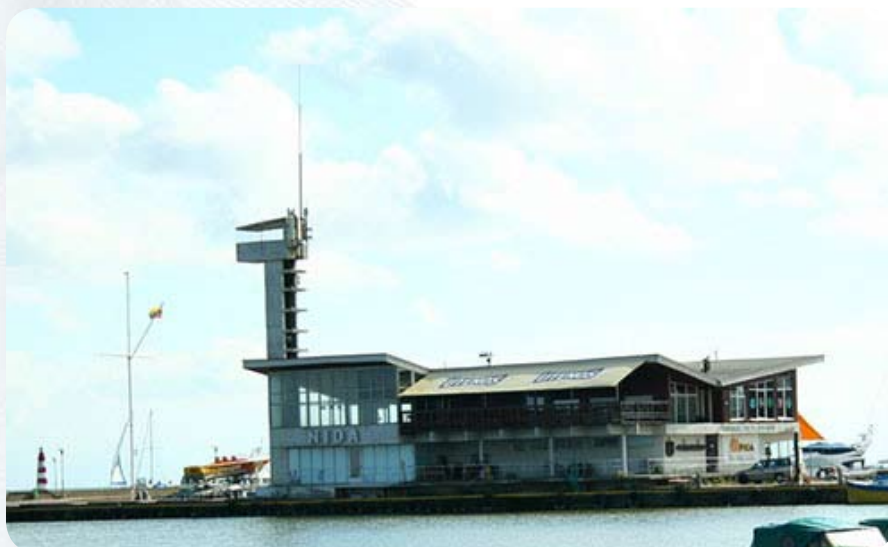
Здание морвокзала в Ниде

Многие из пожилых жителей Литвы говорят по-русски, а молодежь, если и не говорит, то постарается объясниться на ломаном русско-английском языке или позвать того, кто понимает русский, особенно в кафе и ресторанах. Русское население Литвы ассимилировалось, нередки смешанные браки. Видела сценку: класс на экскурсии, детишки стоят парами, где один говорит по-русски, а второй отвечает по-литовски.