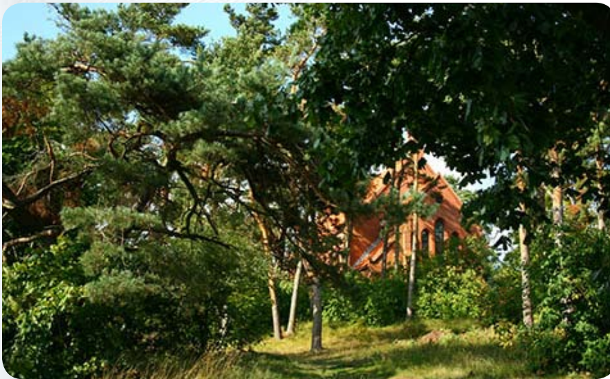
Костел в Ниде