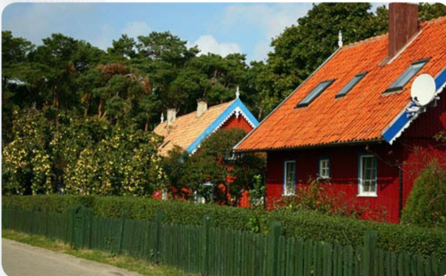
Осень в Ниде

Куршская коса – тонкая полоска суши, шириной от восьмисот метров в самом узком месте и до четырех километров в самом широком, но длинная: до Нида семьдесят километров. Коса состоит из чистейшего кварцевого песка – никакой твердой основы у нее нет. По составу Куршская коса похожа на пустыню. Тем не менее, дикую природу пустынного края удалось приручить и сделать из песчаного, продуваемого всеми ветрами ада настоящий цветущий рай. Здесь высаживали все, что только могло прижиться, скупко сохраняя и накапливая плодородный слой почвы. Однако о столь сложном прошлом теперь ничего не напоминает. Местность поражает многообразием флоры и фауны. Сейчас здесь заповедник, в который попасть можно через особый пропускной пункт, но рейсовые автобусы ходят регулярно, и никто не спрашивает пропуск.