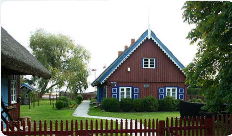
Типичная только для Нида архитектура. Домики охраняются государством. Даже собственник дома не имеет права менять его внешний облик.