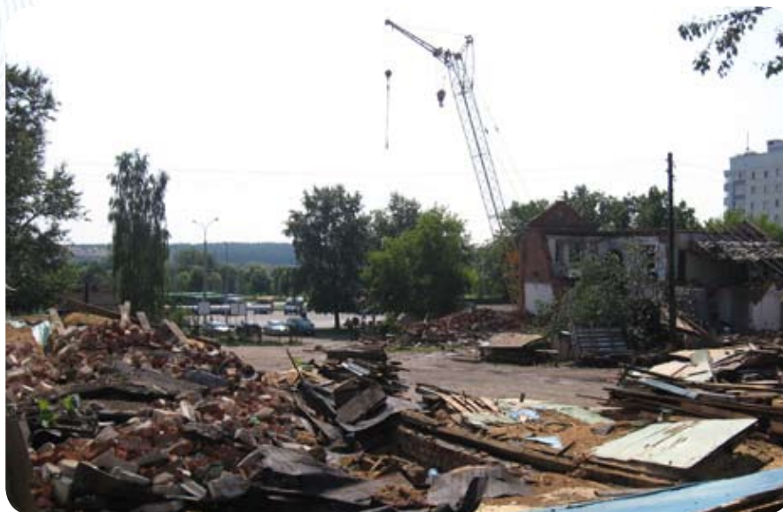
Сейчас стройплощадку «украшают» горы строительного мусора

строительства, которое начнется уже в будущем году. Через несколько лет на площадке за автовокзалом «Московский» появится многофункциональный комплекс, состоящий из нового здания Белгазпромбанка (площадью 16 тысяч кв.м.), апартаментов, физкультурно-оздоровительного центра, административно-офисных помещений, а также двухуровневой подземной автостоянки.