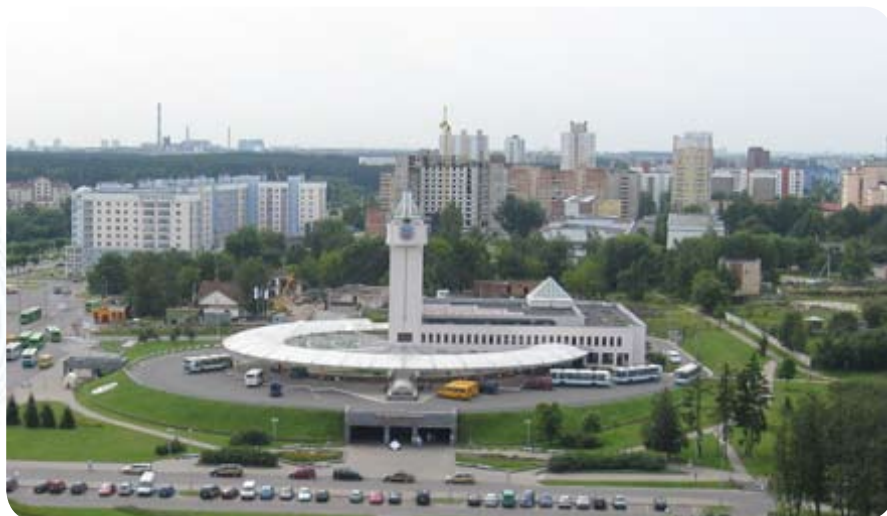
Вид на автовокзал и расположенную за ним стройплощадку с высоты птичьего полета