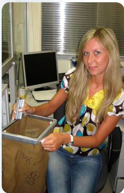
...но прежде их извлекает из инкассаторского мешка девушка-кассир

решения на право ношения оружия при исполнении служебных обязанностей.