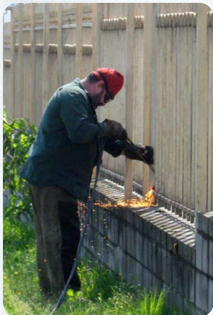
Несмотря на жару, работа спорилась