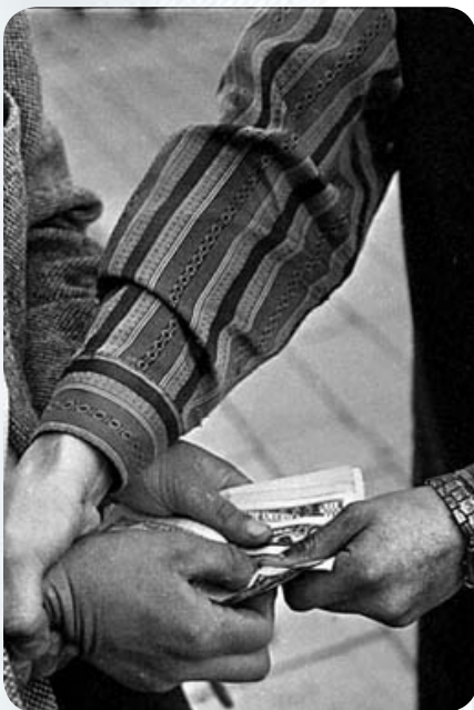
1995 г. Массовым явлением в стране стали «валютчики», банк выпустил первую пластиковую карту