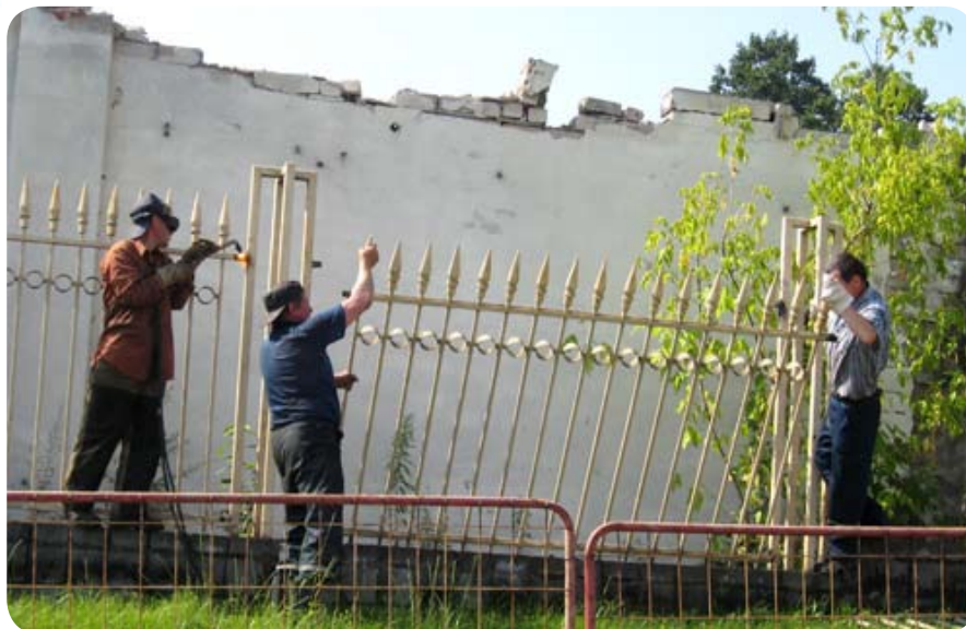
Подготовительные работы на стройплощадке закончатся до конца года. Затем будет объявлен тендер по выбору генподрядчика на основной период