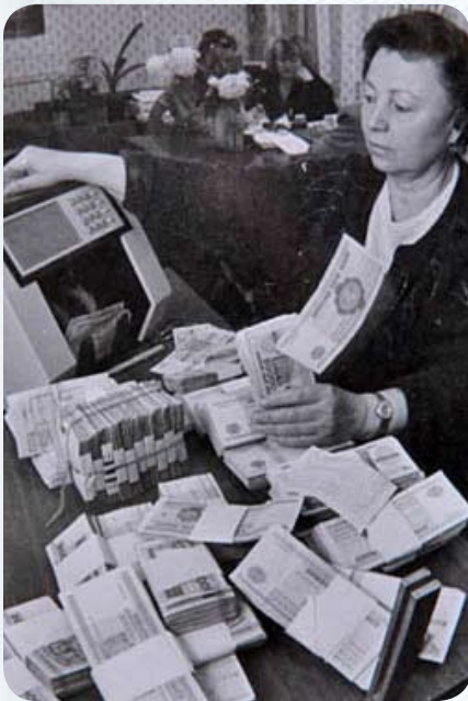
1994 г. В стране прошла деноминация, банк «Олимп» открыл первые филиалы