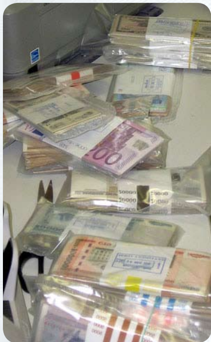
Каждодневная рутина: деньги тщательно пересчитываются...