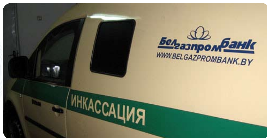
8.15, инкассаторская машина направляется на маршрут

— Сейчас — доставить ценности в три РКЦ. Отдаем сумки и все. Вот вечером долго ездить придется. Выезжаем в 17.00 и до 22.30. Мы — вдвоем, потому что утром