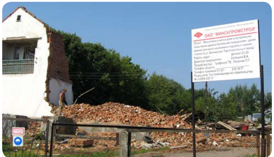
Вход на стройплощадку

Корреспондент «Банк.NOTE» побывал на улице Филимонова 15 июля. Несмотря на жару, рабочие выполняли демонтажные работы на территории стройплощадки. До конца года запланирован снос зданий и сооружений, а также вынос сетей водопровода из-под пятна застройки.