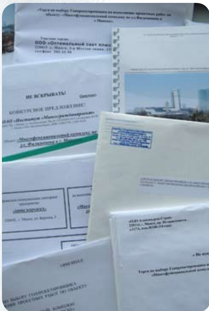
В конкурсных торгах по выбору генерального проектировщика участвуют восемь организаций